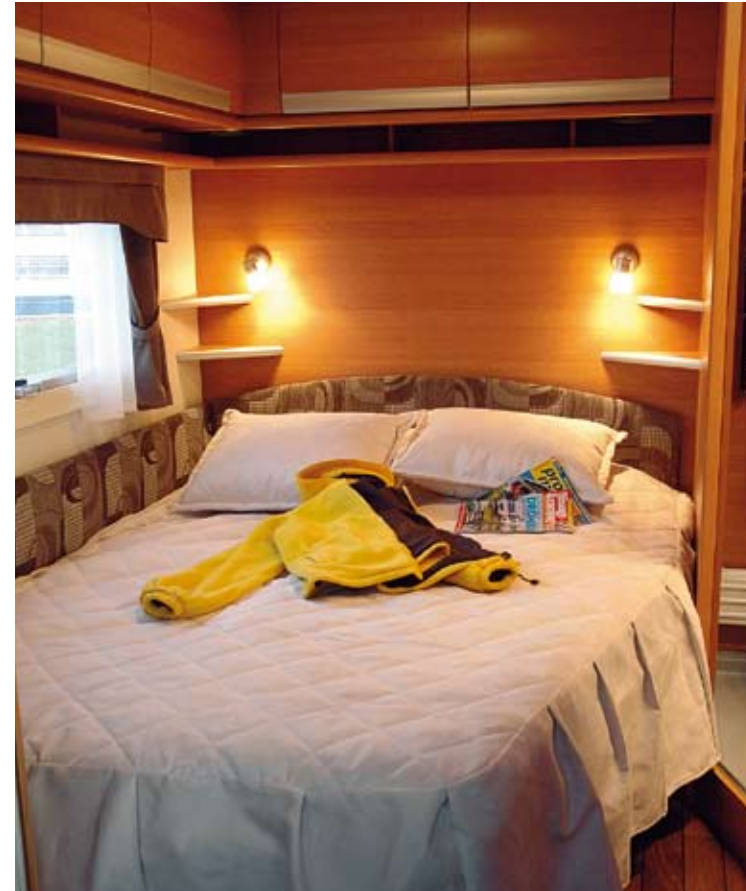
Lika fint sovrum men tyvärr när inte Cabbysängen riktigt våra normmått.

Dubbelsängen i hörnet i Cabbyn har den typiska snedningen vid fotändan. I det här fallet betyder det 20 centimeter smalare bädd vid fötterna än vid huvudändan. För sovkomforten spelar det ingen större roll, men för åtkomligheten till toarummet har det avgörande betydelse. Underlaget är härligt tjock madrass på ribbotten. Huvudändan är ställbar, också ett plus. Vi noterar också med uppskattning att det finns en takventil ovanför bädden.