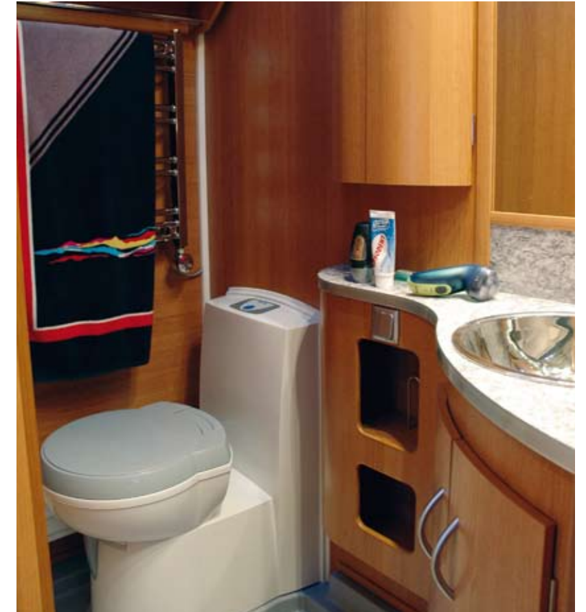
Tvätttrum i trä, populärt bland Cabbys kunder. Duschkran är tillval.

Tvättstället i Cabbyn blänker med sin glänsande rostfria yta. Det är placerat i hörnet, vilket ger bra armbågsutrymme. Spegeln är i vinkel, och belysningen är effektiv nog att klara även en noggrann make up. Under tvättstället finns ett skåp där handdukar kan få plats. Ett ovenskåp över toastolen kan också passa för det, eller annan något skrymmande packning. Ett smalt men högt skåp tar hand om små flaskor och burkar. Toarullen har eget fack, ytterligare ett fack kan ta hand om något annat, och i en öppen hylla kan man ha oömma ting. Den elektriska handdukstorken kommer säkert att uppskattas mer än en gång.