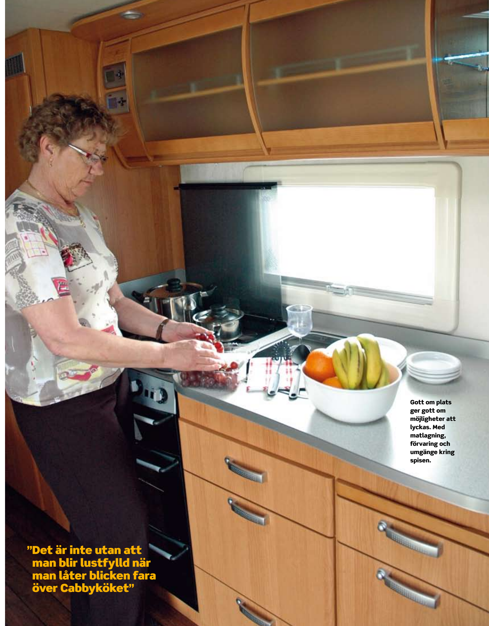
Gott om plats ger gott om möjligheter att lyckas. Med matlagning, förvaring och umgänge kring spisen.

Lusten blir inte mindre inför åsynen av Polarköket. Visserligen finns där den traditionella trelågiga spisen utan ugn, men i gengäld räknar vi till inte mindre än nio präktiga utrymmen, sju lådor och två skåp, under köksbänken. Som nyinflyttad får man tänka två gånger var man har lagt vilken pryl. Så många alternativa ställen att leta på hör inte till vanligheterna i husvagnskök. Lådorna har – liksom i Cabbyn – "soft lock", ☐