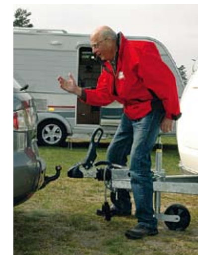
Av och på, byt vagn, se upp, akta lacken. En testares vedermödr.