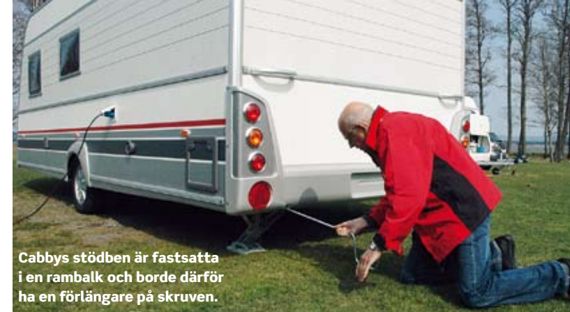
Cabbys stödben är fastsatta i en rambalk och borde därför ha en förlängare på skruven.