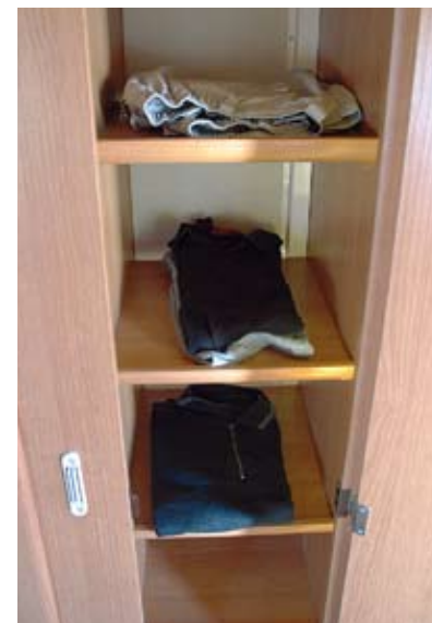
Linneskåp intill Cabbygarderoben.

Motiveringen till poängen för Polaren kan göras nästan ordagrant likadan som för Cabbyn, med skillnaden att linneskåpet i Cabbyn ersätts av byrån i Polaren.