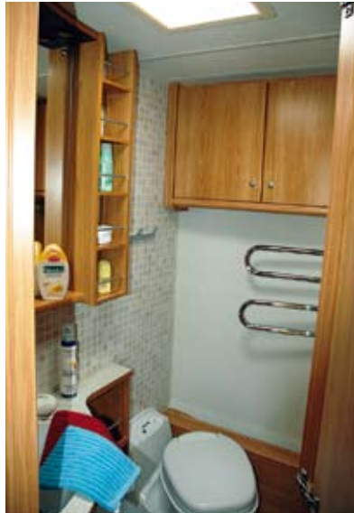
Polar har ett snarlikt men spegelvänt tvätttrum, med duschkran.