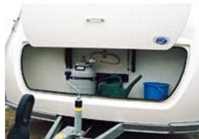
Inbyggd kultrycksvåg, ett bra instrument för att stämma av vägsäkerheten.

I Cabby finns utöver skidfacket en lucka som gör det möjligt att utifrån komma åt utrymmet under sängen,