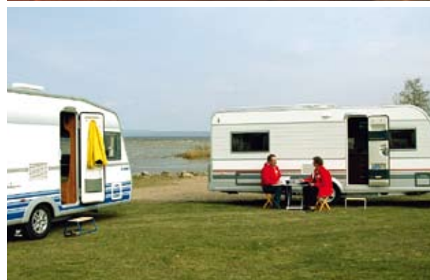
Diskussionens vågor var hetare än Vänerns. Här är vi på Krono Camp Lidköping, mitten av april.