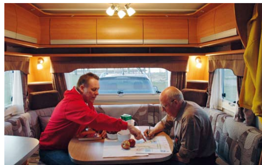
Cabbyns sittgrupp skämmer bort sina gäster. Skönt sittdjup, rymligt bord, bra belysning. Köksbänken stjälv tyvärr cirka 20 centimeter av det användbara soffutrymmet.

När protokollet fylls i är det ibland mycket små detaljer som avgör vilken vagn som får det högsta betyget.