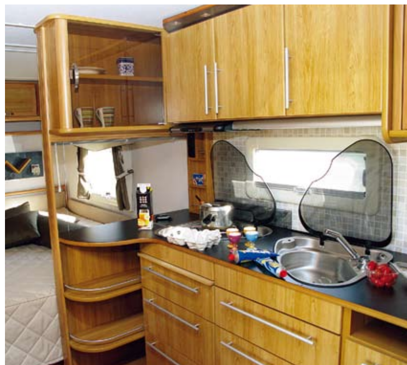
Det är bara att lyfta på hatten för den förbättring Polarköken har genomgått. Allt är rätt, ventilation, belysning, eluttag, utrymmen, arbetshöjd. Ett kalaskök.

men när lådan är stängd här, är den också låst. En detalj som minskar risken för missöden.