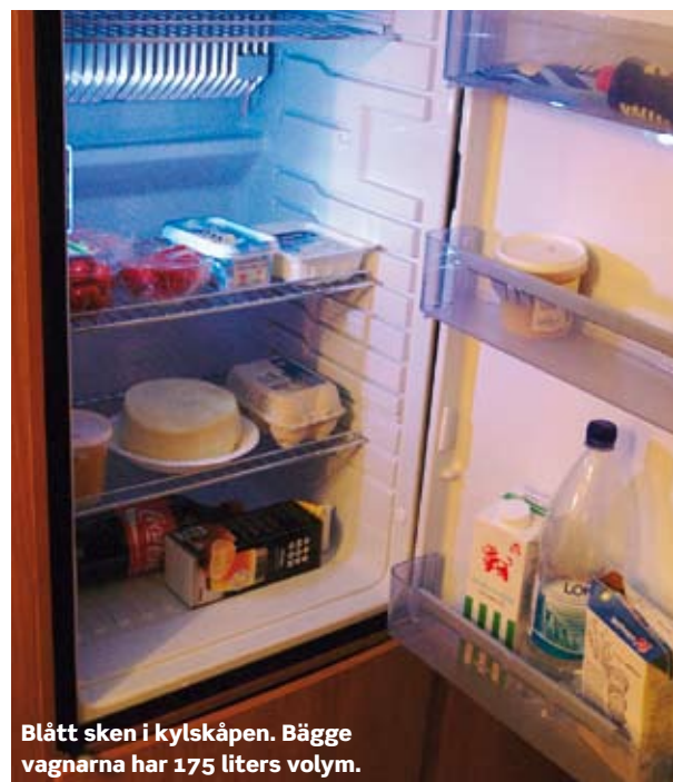
Blått sken i kylskåpen. Bägge vagnarna har 175 liters volym.

Det här är vagnar som uppskattas av erfarna husvagnsägare med höga krav på funktionalitet. Här är det varmt och skönt alla årstider, även inne i skåp och lådor, pastakastrullen får plats i köket, golvytan räcker till för att passera varandra utan risk för kollision. Här bor man bra.