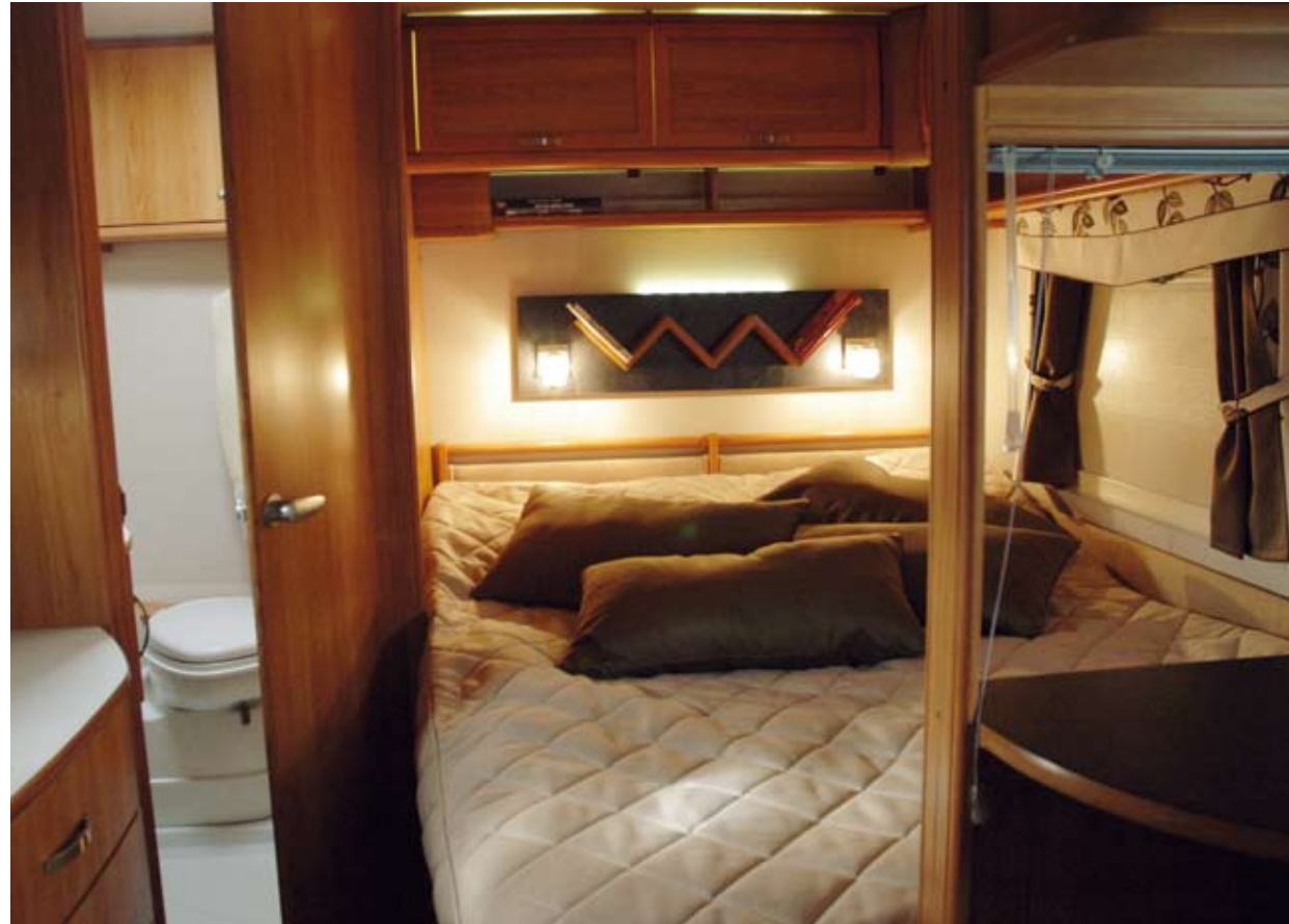
Ett av de allra finaste sovrummen bland husvagnar i dag, med denna planlösning skall tilläggas. Polar.