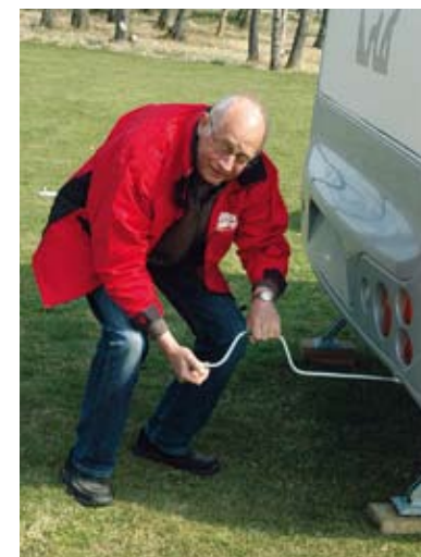
Polar har bultat stödbenen i golvet, skruvarna är mer lätthanterliga.