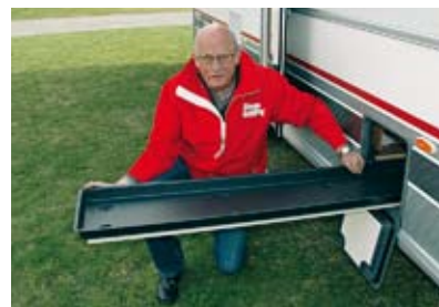
Lastluckan i Cabby är stabil och lätt att skjuta ut och in.

I rondens utvändiga lastutrymmen kan vi i test efter test se att alltför många vagnar har luckor i karossen som ger åtkomst till utrymmen under sängar, i sofflådor och liknande. Dessa vagnar är inget undantag men Polar har bara en lucka, och den är relativt liten. Via den kommer man åt utrymmet under tvärsoffan längst fram. Likadan lucka finns i Cabbyn. Här är inredet en lång utdragbar balja som löper på en skena. I Polar ligger det en liknande balja, men – visar det sig – en mycket sladdrig plastbalja på golvet i det långsmala utrymmet. Det är alltså inte en utdragbar lastlåda.