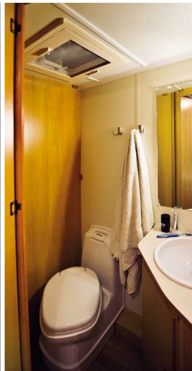
I Eximo är det skönt och ombonat. Inte heller här kan man duscha. Plus för taklucka och hörnmomterade speglar.

per som handdukar. Dusch finns inte. En lustig detalj i Eximo är att vatten till toaletten fylls på utifrån, övrigt vatten tas från dunken som står i underskåpet. Inte heller i Eximo duschar man, men även här är det ombonat med mycket och ljus trä. En del skåputrymme försvinner i och med att vattendunken härbergas här. Eximo är hårt men effektivt belyst av ett i hörnet stående lysrör, likadant som det i köket.