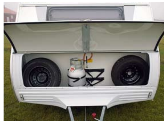
Eximos koffert har en lasttröskel på 25 centimeter.

Carado.....7 poäng Eximo.....6 poäng Lastluckan och den något bättre utformade gasolkofferten ger poäng till Carados fördel.