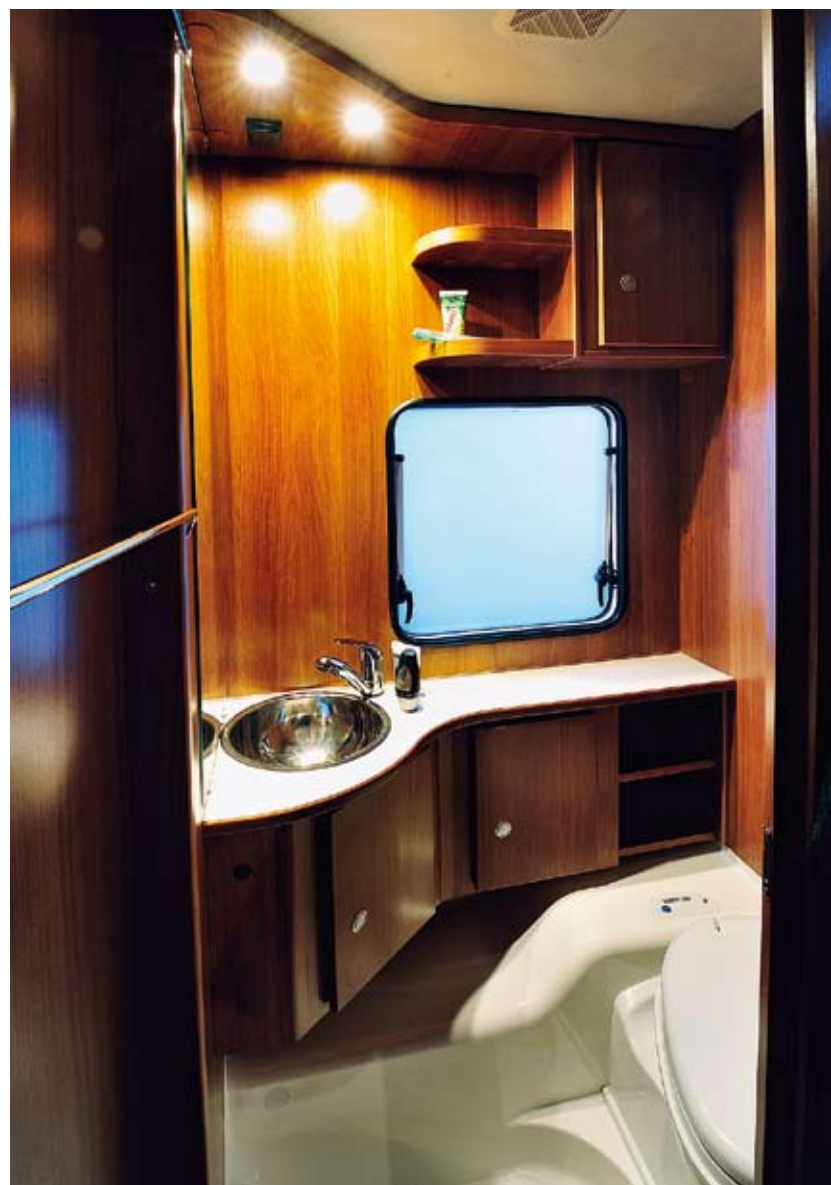
Tvätttrummet i Carado är befriande rent från kalla plasttytor men man kan heller inte duscha här.

Tvätttrummet i Carado ger ett ombonat intryck med plast bara på golvet, allt övrigt är av trä. Här hittar vi två skåp i handfatsskåpet och ett på väggen ovanför det gråmelerade fönstret. Rummet är trångt men klarar normmåttan. Bra belysning som hanteras via en knapp i barnvänlig höjd. I taket finns förutom ett uttag för hårtork eller rakapparatur en ventil. Dörren sluter tätt så ventilation torde ske via fönster och takventil. Här finns hållare för såväl toapapper