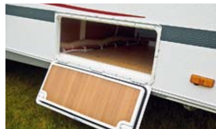
Luckan i Carado leder till utrymmet under dubbelsängen.

Carado har en bättre utformad gasolkoffert än Eximo som har en hög lasttröskel (ca 25 centimeter). Båda koffertarna är vagnsbreda och ger plats för grill och campingmöbler. Öppningsvinkeln på koffertluckan är ungefär lika generös på bägge vagnarna. Bara Carado bjuder på lastlucka. Luckan ger åtkomst till utrymmet under dubbelsängen. Härinne finns också vattentanken och varmvattenberedare, men utrymmet räcker gott till alla handa grejer. Vi saknar en skiljevägg så att utesaker, till exempel sportutrustning inte blandas med inre grejer typ extra sängkläder.