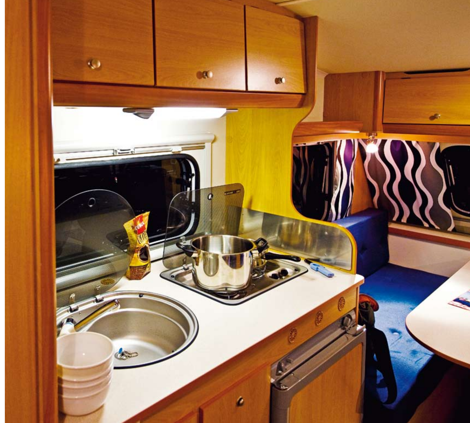
Eximoköket rymmer kylan som installerats med korrekta luftspalter under och över skåpet vilket i sin tur gett bänken 97,5 centimeters höjd.

I Eximovagnen ställer man inte till med några kulinariska extravaganser. Köket har två brännare, här är snålt med plats för allmänt köksarbete och eftersom det bara finns två lågor måste man flytta undan till exempel potatiskastrullen för att värma till exempel såsen. Då finns ingenstans att göra av den heta kastrullen, man