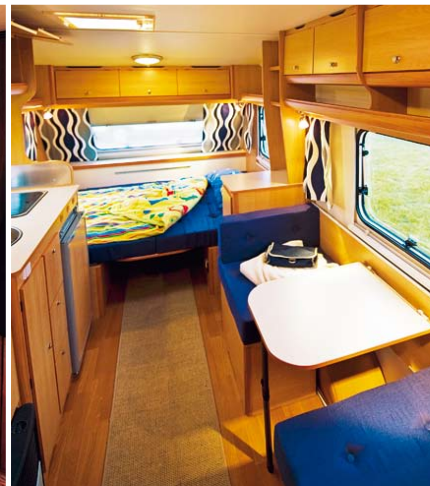
Med bäddad säng i Eximo erbjuds en dinett för två. Och nu har ju ungarna somnat.

Nu tar Carado tillbaka förlorad poäng. Det som i Eximo också är en sittgrupp blir av naturliga skäl inte lika bekväm som säng som en fast madrass är. Våningssängarna i Carado är också bredare och därmed bekvämare för lite större barn. Det finns också ett fönster till bägge sängarna i Carado och längs hela