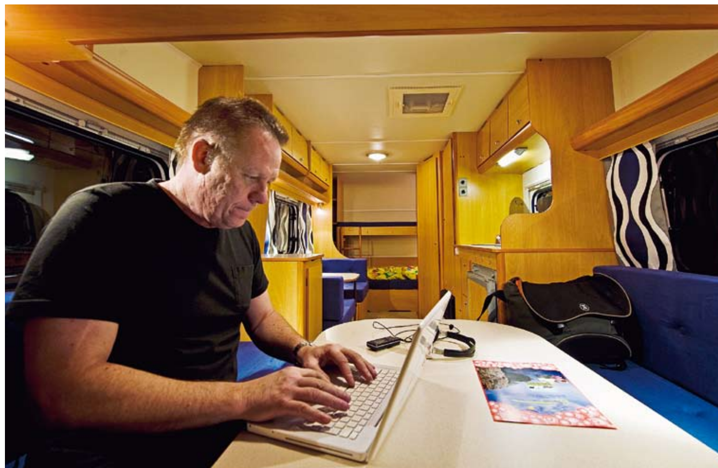
Trots att bägge vagnarna är hårt prispressade och tillverkarna har sparat på marginalerna finns det inget i vagnarna som känns billigt. Här Eximos sittgrupp.

Sällan har det väl varit så svårt att bedöma en rond som denna. I Carado finns bara en sittgrupp och den är inget vidare bekväm, i Eximo finns det två men ingen av dem är heller något att skriva hem om. Eximo vinner rondens till sist, för här finns gott om svängrum vid bordet och även om det inte är bekvämt så kan man bjuda in grannarna på mat