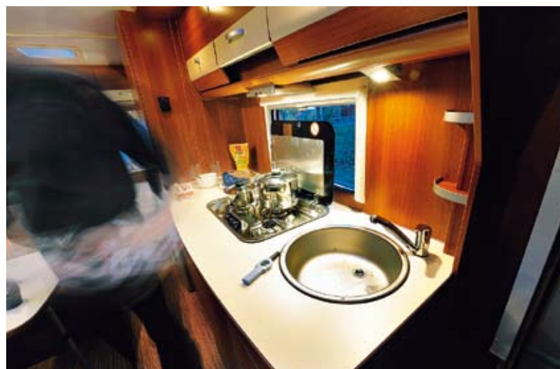
Fart och fläkt i Caradoköket men fläkten är tillval.

Detta är en bra rond för Carado. Kökskivan är rejäl med tre brännare på spisen, med gott om plats för såväl heta kärl som för allmänt köksarbete. Här finns tre överskåp och i köksbänken finns förutom kylan två stora skåp och en besticklåda. Det hela illumineras av tre spotlights, två i takkornisken och en under överskåpen riktad mot diskhon. Skall man anmärka på något skall det i så fall vara att köksbänken, som för övrigt är imponerande 160 centimeter lång, också är väl tilltagen i höjdmått - 94 centimeter är fyra högre än ideal-