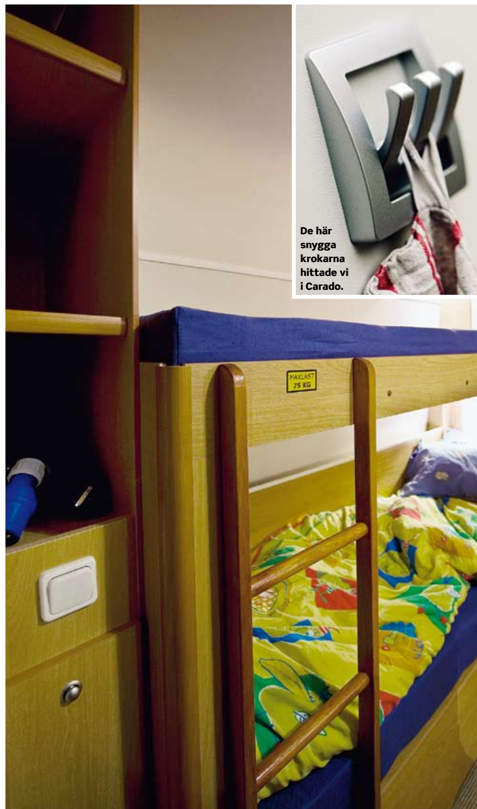
De här snygga krokarna hittade vi i Carado.