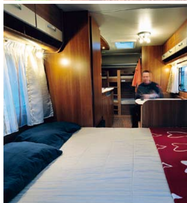
I Carado står sängen alltid klar, härligt vid bäddags men det stjälar utrymme från umgängesytorerna.

Eximo.....5 poäng Mått dubbelsäng: 150 x 210 cm (130 x 195) Våningssäng barn: 193 x 57 cm (75 cm bredd ingen längdstandard) Annan säng: Dinettgrupp 65 x 187 cm (inget standardmått)