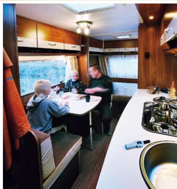
I Carado ryms fyra runt bordet, men då får inte alla vara vuxna.

Eximo vinner för att den har två sittgrupper, inte för att den är bekväm. Dessutom har man bättre belysning i Eximo. Carado förlorar rondens för att dynorna är utan spänst, och sittplatsen är för trång för fyra vuxna. Den indirekta stämningsbelysningen i ljuslisten ovanför sittgruppen är snygg, men ger inte Carado bättre betyg än knappt godkänt.