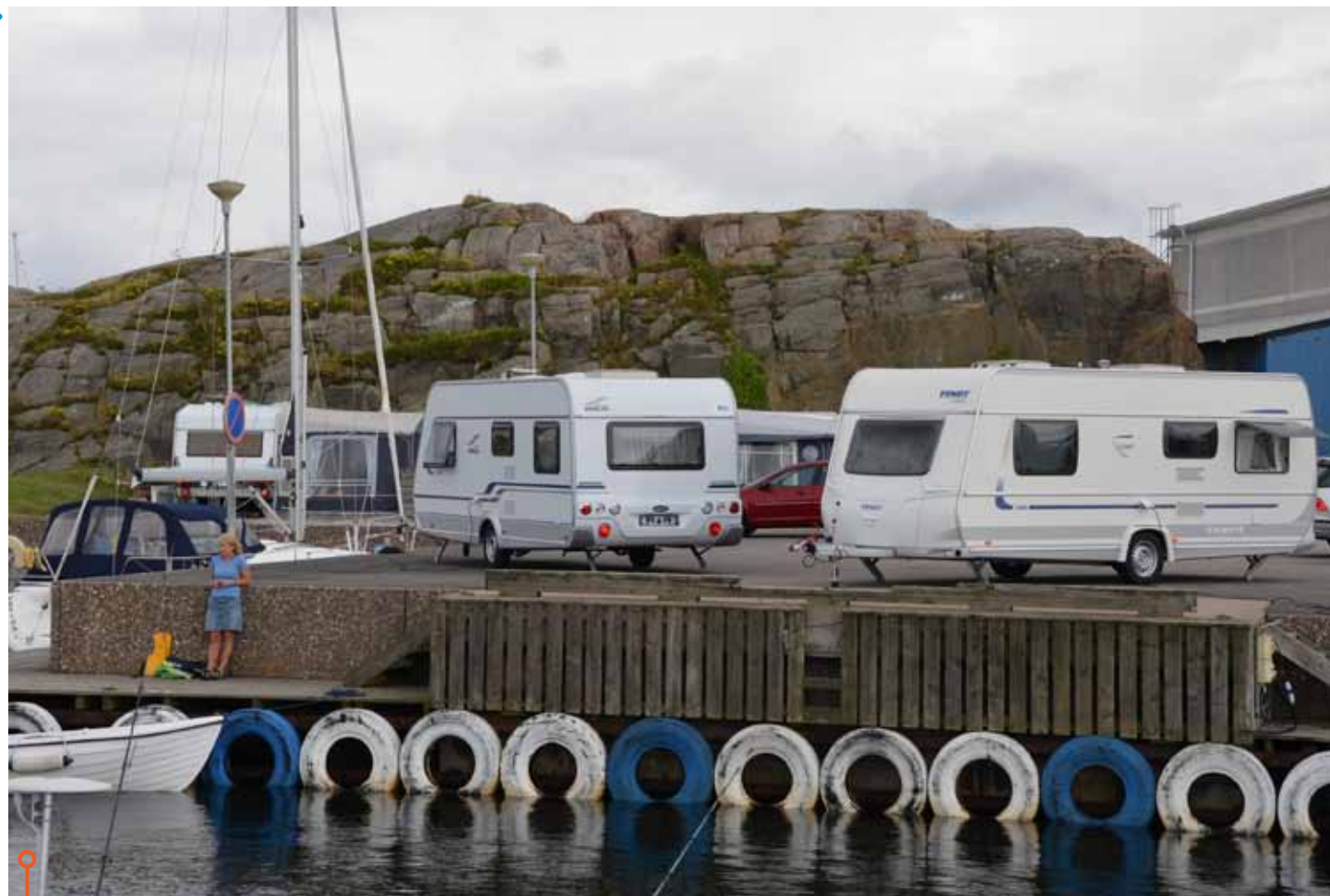
Enkla att rangera, följsamma på vägen och sköna att bo i. Både hos Wilk och Fendt får man mycket för pengarna.