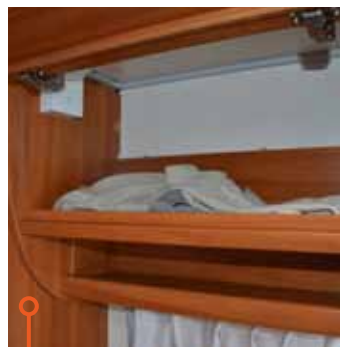
I överskåpen finns det luftspalter på Wilkvagnen.

VAGNARNA GÅR ATT ventilera effektivt med stora fönster, central