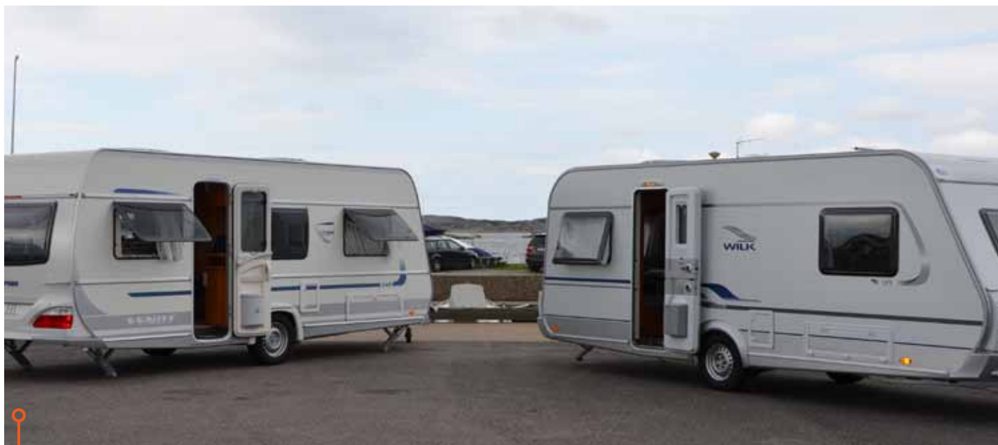
De yttre lastluckorna sitter på höger sida i vagnens färdriktning.

» Wilk har bästa lastförmågan och flest skåp. Bra är de båda, men delbar ytterdörr och distansskivor runt om ger en extrapinne i protokollet.