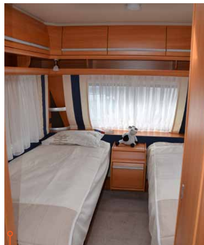
Fendts säng är utrustad med elastiska ribbor och ställbar hårdhet via reglerbar ribbotten.