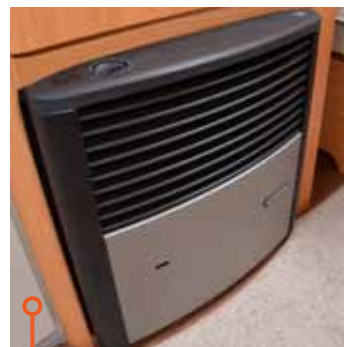
Wilks Trumapanna har två kW högre effekt än Fendts.

I Fendt Saphir heter pannan S 3002 (2kW lägre effekt) och även här finns varmvattenberedare och elektrisk golvvärme. Vattentanken är betydligt mindre i Fendt, 25 liter, men samma rullbara tank har även hittat in i Fendts gasolkoffert där den