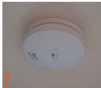
Fendt har i alla fall en brandvarnare.

med höga poäng, så heller inte den här gången. Båda vagnarna har jordfelsbrytare, Fendt har brandvarnare, men där tar säkerhetsutrustningen slut.