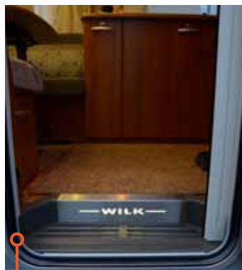
Wilk välkomnar med ett belyst trappsteg.

VI VÄRDERAR HÄR TEKNIK som gör campandet lättare och roligare. Till exempel uppskattar vi om kylskåpet själv väljer energikälla (AES), om vagnen har radio, belysning i gasolkofferten och i garderoben. Stadiga plattor på stödbenen gillas också. Vi börjar ronden i Wilk som har ett belyst trappsteg innanför ytterdörren, och en hel myggnätsdörr. En-nyckelsystemet som är så bra att vi undrar varför det inte snart är standard på alla husvagnar får vårt gillande, men