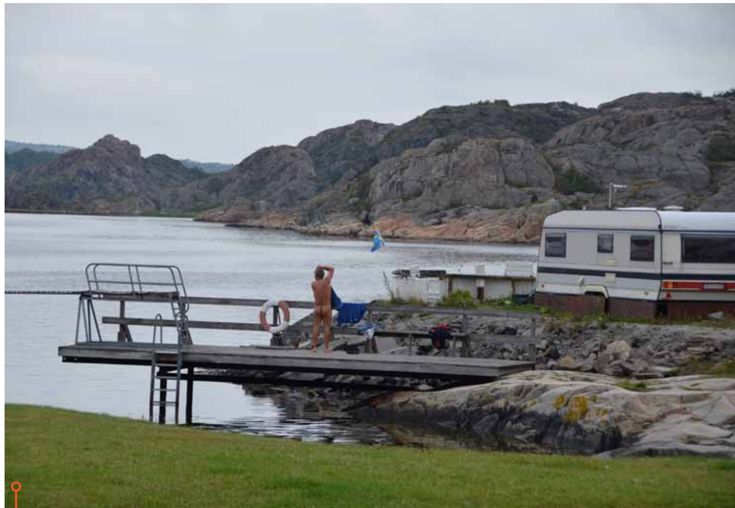
Duschmöjligheter finns inte i någon av vagnarna, men har man tur kan man som den här mannen tvaga sig i havet!

» Medan Wilk har en traditionell taklucka har Fendt ett frostat öppningsbart fönster som man givetvis inte kan se igenom.«