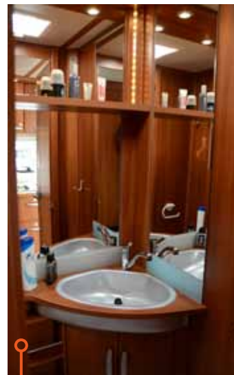
Bättre med utrymme är det i Wilkvagnen.

» Olika lösningar men samma tilldelning av poäng – igen. Bättre ljus, stadigare dörr och handdukshållare tar igen det som Fendt tappade inledningsvis på det trängre utrymmet.