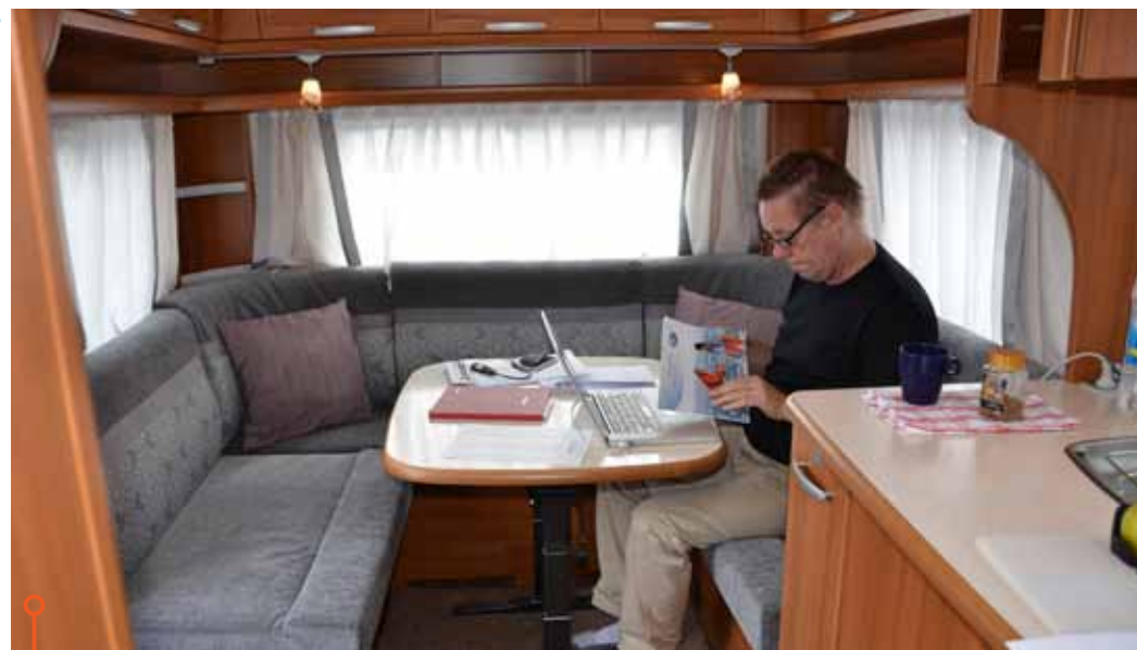
I Wilk kan vuxna knappt sitta i den tvärställda soffan, med ett sittdjup på bara 34 centimeter.