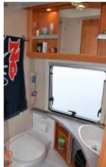
Fendt är lite plastigare, lite enklare – men lika bra.

» Medan Wilk har en traditionell taklucka har Fendt ett frostat öppningsbart fönster som man givetvis inte kan se igenom.«