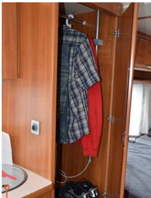
Garderobsutrymmet är närapå exakt lika stora, plus blir det dock för Wilk då över-skåpen har distansskivor.