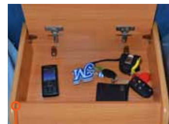
Nattduksbordet i Fendt.

Bra ljus och ventilation under dagtid har båda vagnarna via tre stora fönster, framåt kvällning kan det bli riktigt mörkt då taklamporna lyser med sin frånvaro.