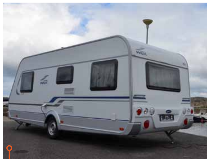
Wilk Sento 530 UE drog till slut det längsta strået. Med två poängs marginal vann den testet.

»Som helhet gör vi bedömningen att detta är två prisvärda vagnar som på ett alldeles utmärkt sätt bidrar till att göra campinglivet ännu roligare.«