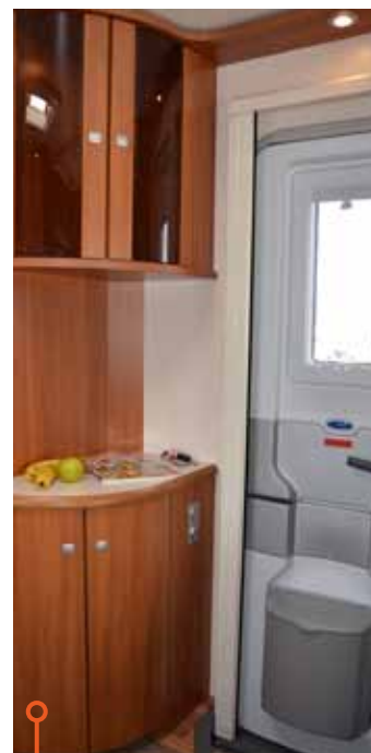
Wilk har delbar ytterdörr och en liknande hallmöbel som Fendt.