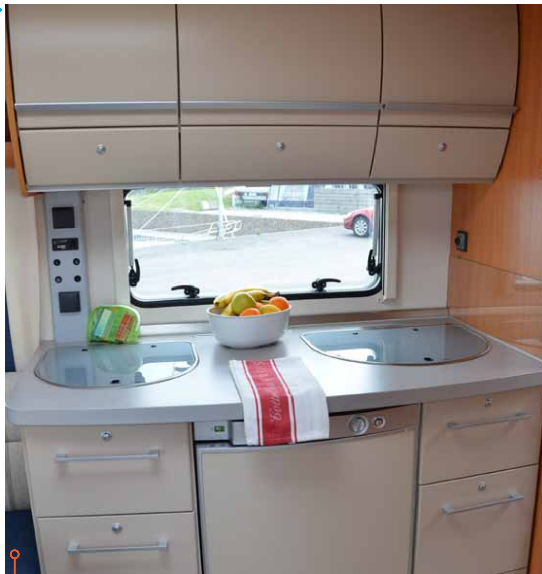
Fendts kök sticker ut något och bryter mot övrig körsbärsträdekor.