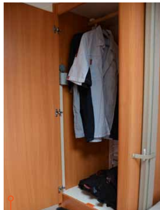
Fendt klarar sig bra i denna rond och är en god utmanare till erkänt förvaringsstarka Wilk.