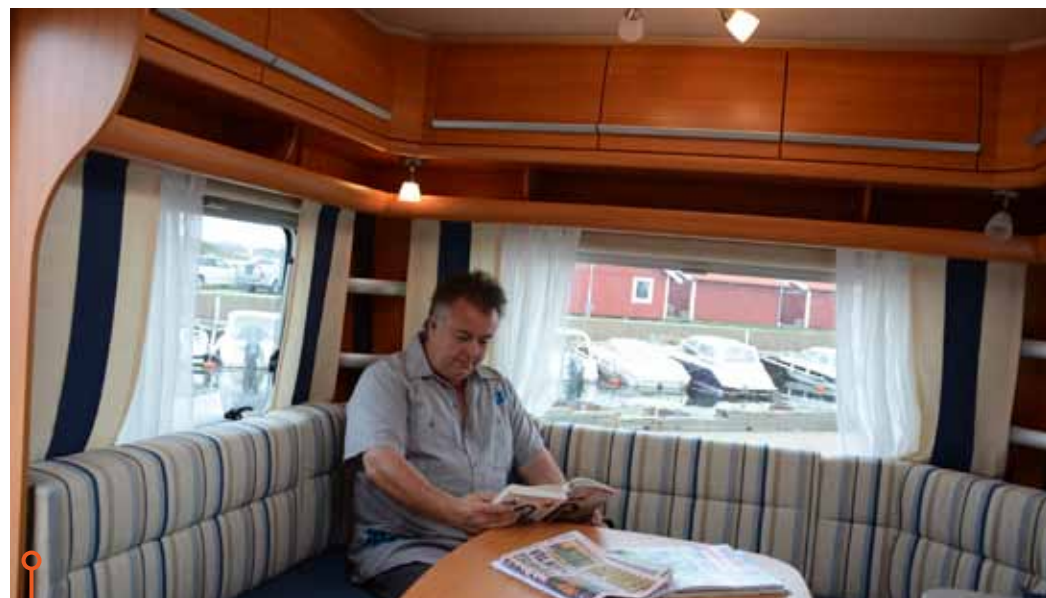
God belysning och dubbla 230-uttag är plus i kanten hos Fendt.