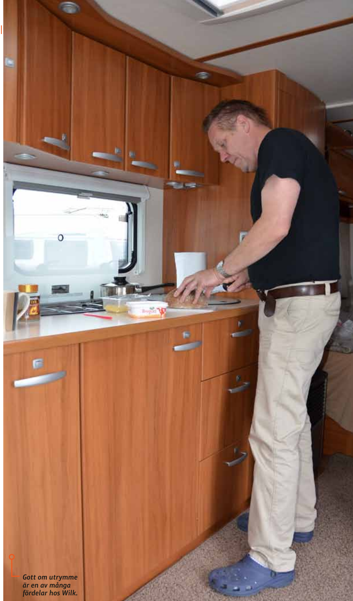
Gott om utrymme är en av många fördelar hos Wilk.

» Vi har två mycket funktionsdugliga kök och de snuddar båda vid åttor i betyg. Även om vi charmas av Fendts design är vi obönhörligt omutbara. För att tillskansa sig extrapoäng hade det krävts fläkt eller någon form av ugn.