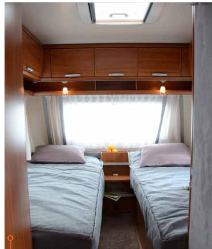
Reglerbar vinkel vid huvudändan hos Wilk är underbart ur läsa-bok-synpunkt.

»Återigen en jämn rond. Fyra komfortabla sovplatser i en medelstor husvagn är kanske inte något ovanligt, men det är likväldigt bra.«