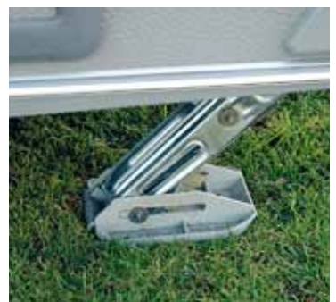
Stora fötter är alltid bra. I synnerhet när man står på mjukt underlag.