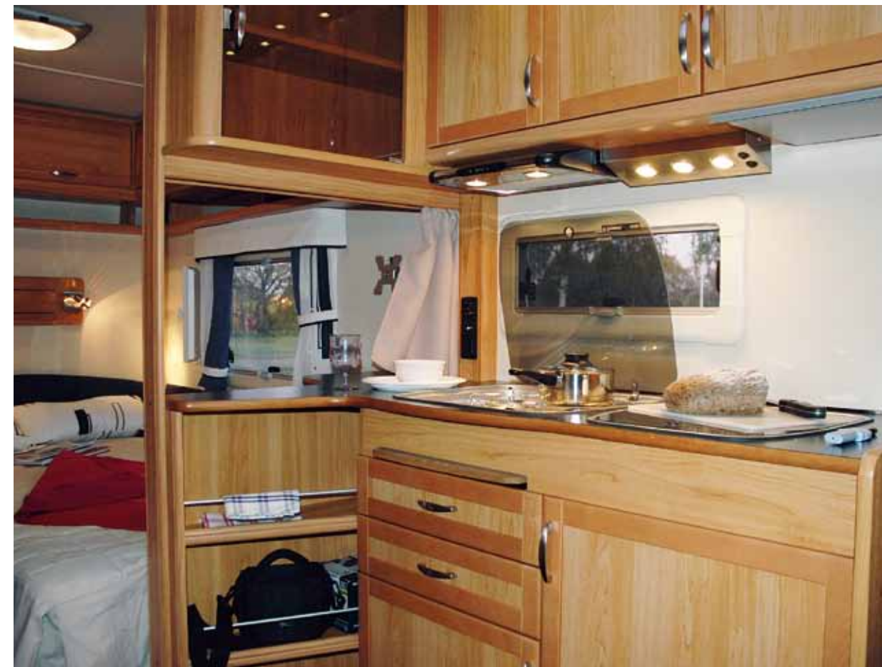
Solifer har ett klassiskt kök som fungerar hyggligt men som inte bjuder på överraskningar.

Köksbelysningen består av spotlights i takrampen, i fläkten och i undersidan ovenskåp. Den stora takluckan släpper in dagsljus, och i ramen runt den sitter ytterligare spotlights.