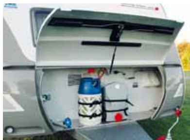
Bra och lastvänligt gasolutrymme på Hymer.

Fendts lastlucka ger åtkomst till utrymmet under bädden, men inte så bra tillträde till gasolutrymmet. Hymer har störst och bäst förvaltad gasolutrymme. Bara Solifer har skidlucka. Lastlucka till sänglådan är standard i de andra två, men tillval i Solifer.