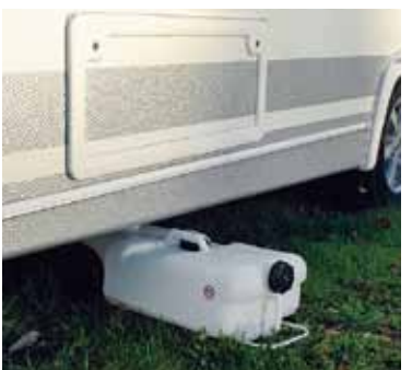
Utvändig avloppstank står det i Fendtvagnens faktaruta.