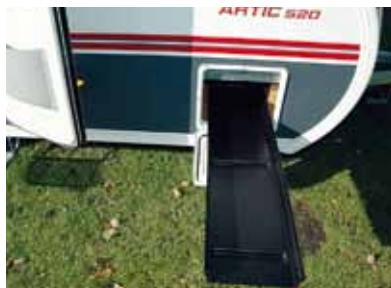
Solifer bjuder på åtkomst till utrymmet under främre tvärsoffan.