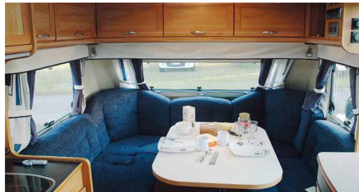
Solifers sittgrupp är den minsta i gänget. Den är också onödigt krånglig att komma in i då bordet är bredare än utrymmet mellan sofforna.