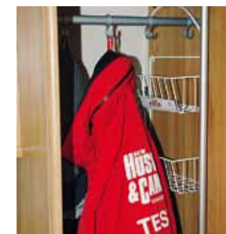
Trådbackarna hittar vi i Solifers garderob.

förutsättningar för de rymliga överskåpen, och den 40 centimeter längre karossen ger mer utrymme.