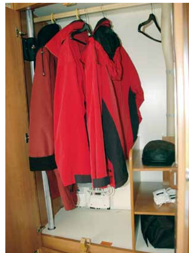
Garderoben i Fendt är mycket rymlig och tillträdet sker genom två dörrar.

"Står man mitt på golvet när man väggarna med båda armbågarna vid minsta rörelse"