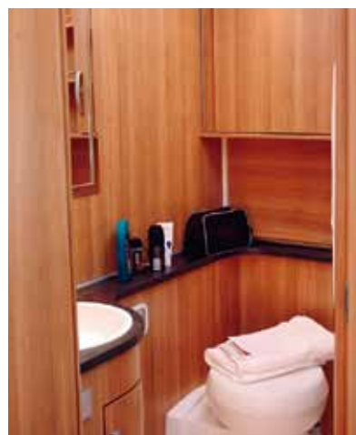
Mycket trä men lite duschkabin. I Hymer (och Fendt) finns det ett duschdraperi.

Hymervagnen har motsvarande lösning när det gäller utdragbar dusch-