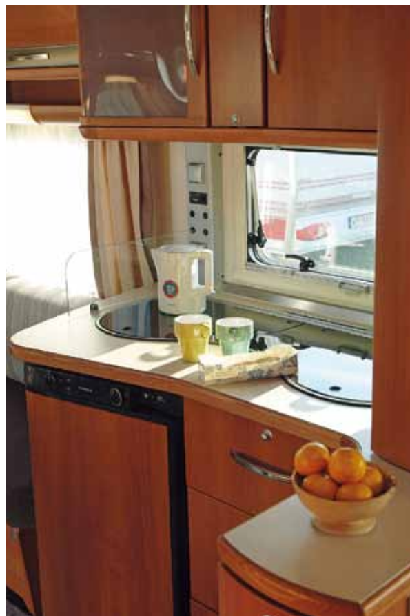
Solen skiner på Fendts fina kök.

Fendt har de egenskaper tresäsongsvagnar alltid haft. Som i Hymer frysrisk för vatten när det är minusgrader utomhus.