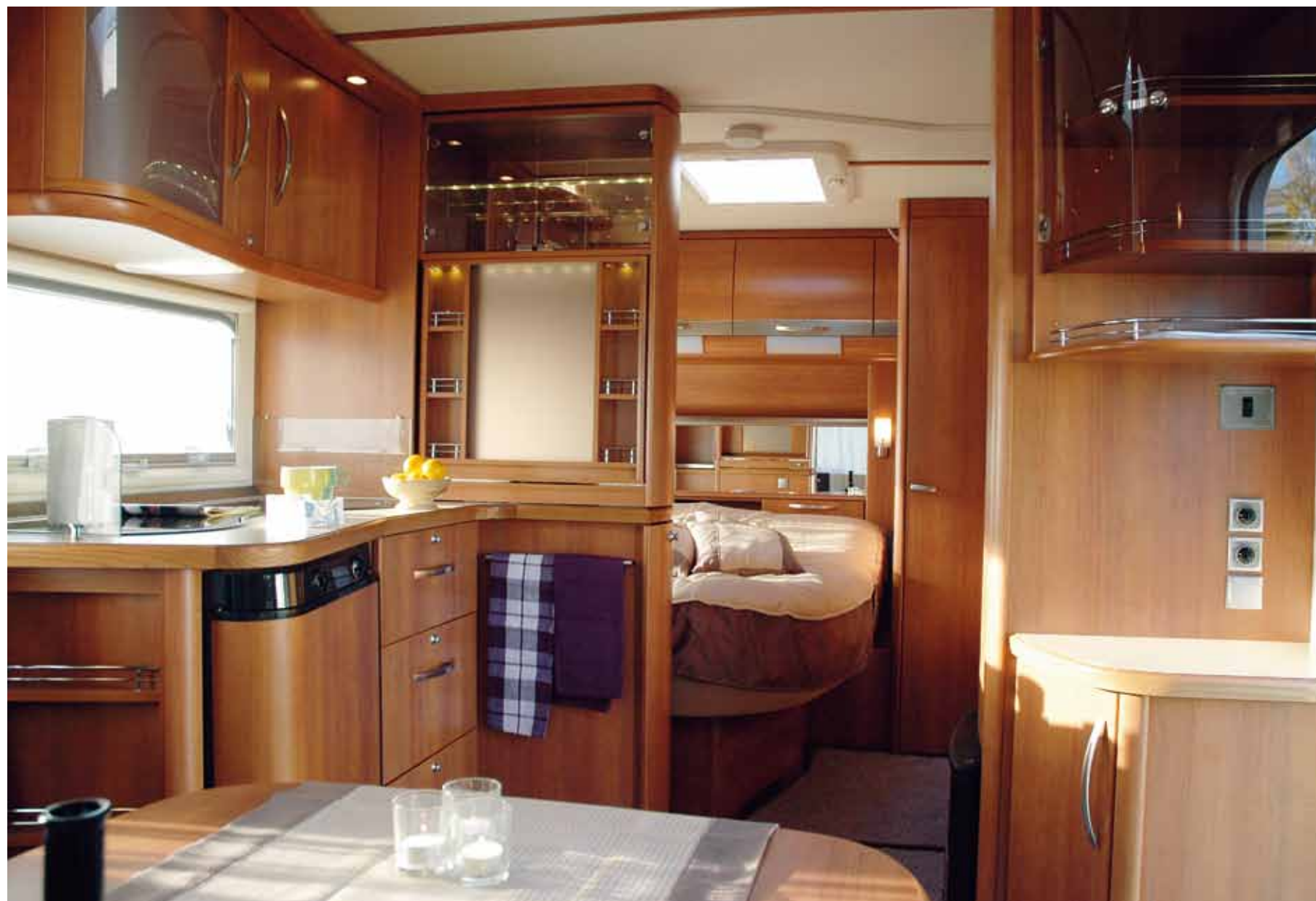
Vitrinskåpet i Fendts kök är inte bara vändbart så att man kan titta på tv, från sovrummet eller från sittgruppen, det är också utdragbart. Med skåpet inskjutet blir planlösningen luftigare.