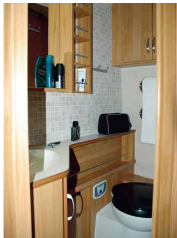
Fendt.....6 poäng Bredd framför tvättstället: 80 cm (70 cm) Höjd tvättställ: 83 cm (85 cm) Benutrymme framför toastol: 50 cm (28 cm)

Effektiva spotlights ger bra ljus över spegeln i hörnet.