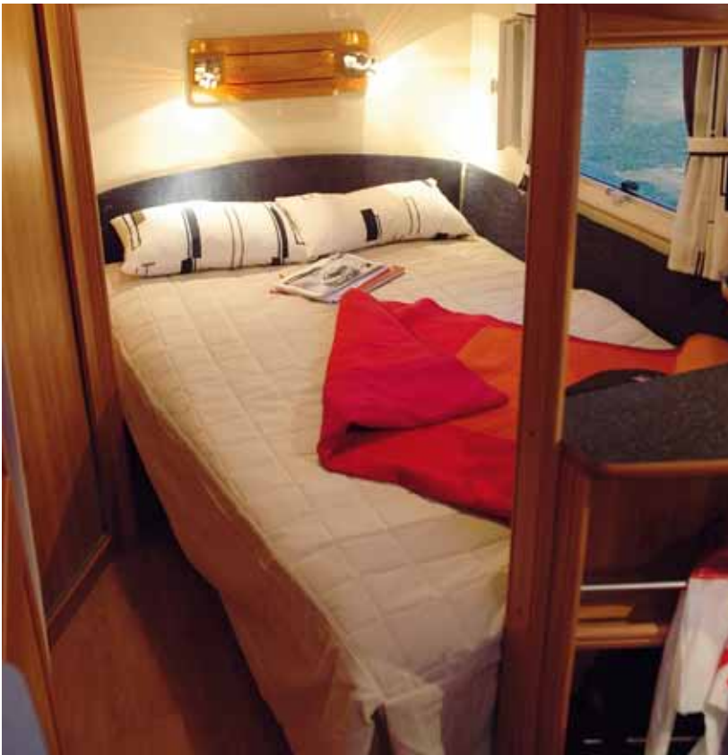
Man sover skönt i Solifer med vädringsbeslag. Bra läslampor och en öppen hylla för småsaker. Tidningen kan klämmas fast bakom gummibandet på den lilla hyllan.