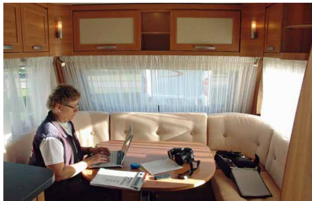
Hymervagnens sittgrupp är riktigt stor. Vagnen är fullbredd och cirka 40 centimeter längre än de andra vilket naturligtvis skapar rymd och luftighet.