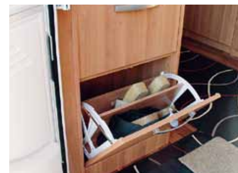
Skoskåpet sitter direkt innanför ytterdörren i Hymer.

Av de tre vagnarna är Hymer inte bara längst, den är också högst invändigt, 198 centimeter. Det skapar