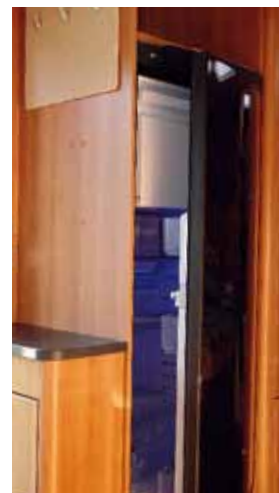
Det 197 liter stora kylskåpet i Hymer rymmer också en uttagbar frysbox.

Dometics stora kylskåp, 179 liter, med löstagbart frysack finns vid motsatta väggen, med skåp både över och under.