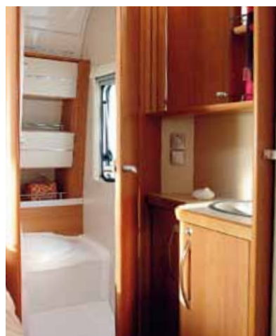
Tvätttrummet ligger utanför toan i Fendtvagnen.